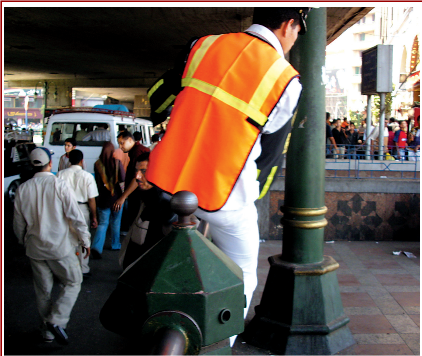
عسكري مرور بينظ من سور عبور المشاة في ميدان رمسيس.. صباح الانضباط